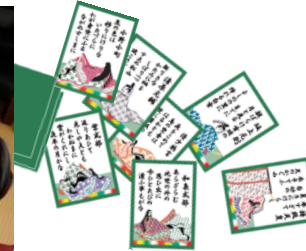
腕まくりをして 真剣勝負です