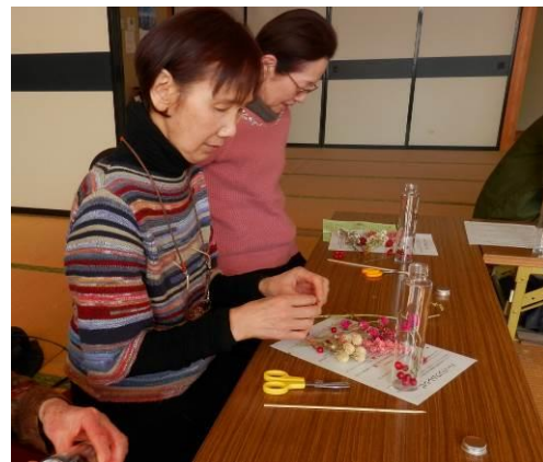
ビンの中にお花を入れるよ